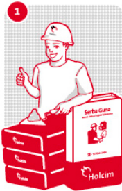
1 Pakai semennya

Untuk diteruskan ke PO BOX 99 JKTM 12700