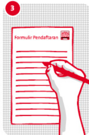
3 Isi dan lengkapi formulir-nya dengan tanda tangan pemilik rumah/toko