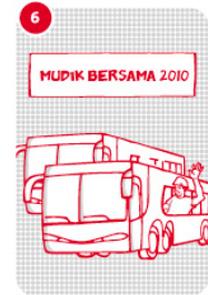
6 Berangkat mudik