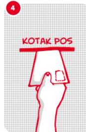
4 Kirim formulir dengan 5 logo Superbrand-nya ke kantor pos