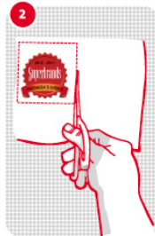
2 Gunting 5 logo Superbrand-nya